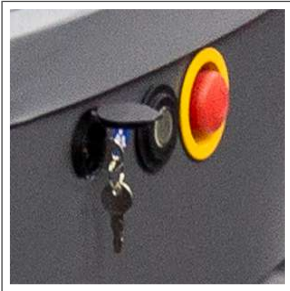
Parada de emergencia Indicador de estado Llave de apertura