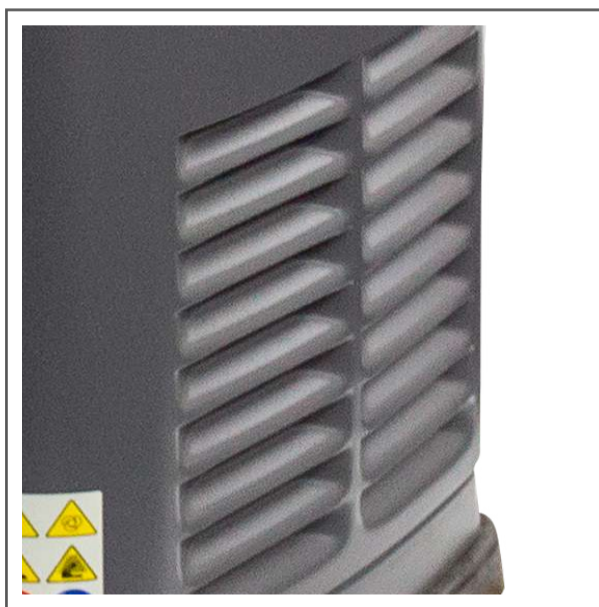
Salida de ventilación