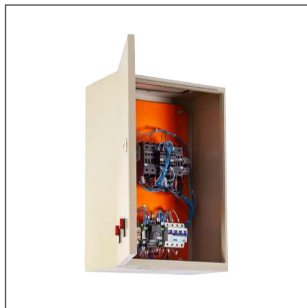
Tablero automático incluido